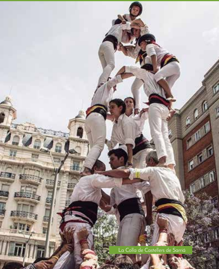
La Colla de Castellers de Sarriá