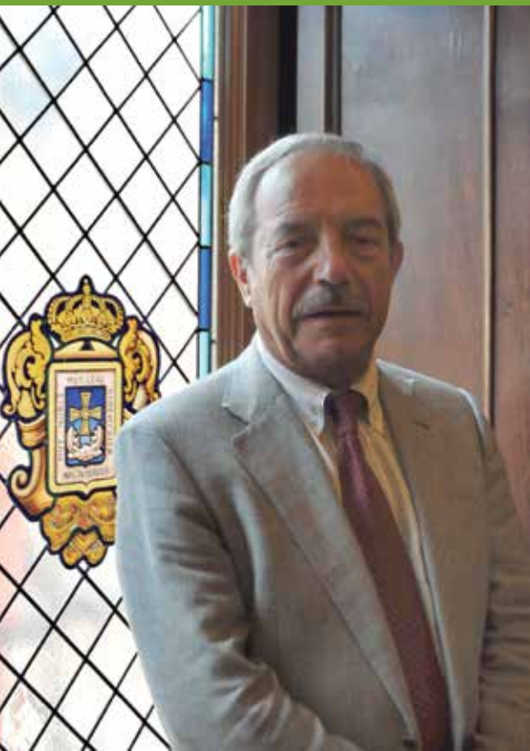
Wenceslao López, Alcalde de Oviedo