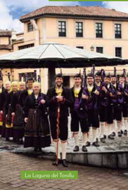
La Laguna del Torollu