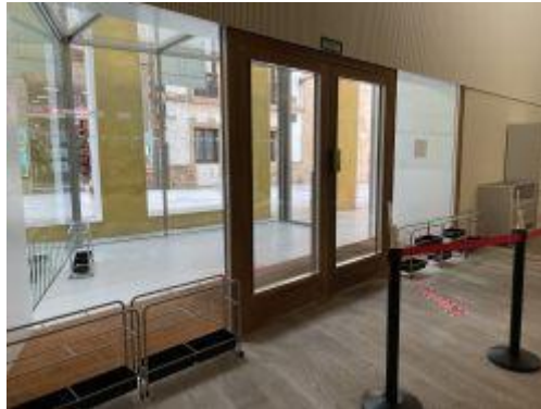
Edificio Palacio de Velarde por la C/Santa Ana