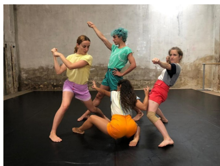
Público familiar / 30 minutos