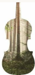
VII SOL CELTA 2-8 XUNETU ZONA VIEYA